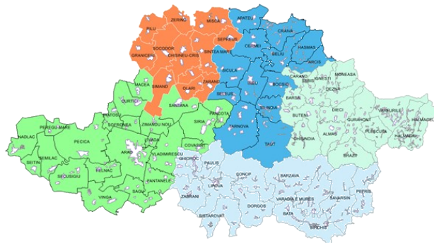
Figura 2 Zonele de colectare din județul Arad